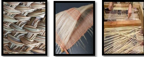
شكل رقم(١ : ٣) ألياف طبيعية من الفن البيئي وطفنت بتراكيب نسجية علي النول اليدوي - نقلا عن

حيث الاستلهم من النقطة واللون وتنوع الملامس المختلفة علي سطح الحشرات وأجنتها وذلك بتوظيف بعض الأساليب التقنية والتراكيب النسجية الهامة لإعداد الطالب داخل قسم التربية الفنية وطبقا لمخرجات توصيفات مقررات أشغال النسيج فإن الأمر يتطلب أن يلم الممارس والطالب بالعديد من الخبرات التشكيلية والتراكيب النسجية التي تسمح له بإمكانية تطويع الخامة بما يتناسب والتعبير عنه وبطبيعة الحال فان تشكيل المشغولة النسجية يعتمد علي العديد من الخامات و التقنيات الأشكال من(١ : ٣).