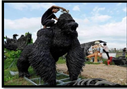
شكل رقم (٨) منحوتة فنية بيئية من الإطارات المطاطية نقلا عن (https://images.app.goo.gl/zEJReqfMHbgGjCWA9)

نسبياً إلى أنه فرض حضوره علي الساحة الفنية حتي بات يطلق عليه الفن الجماهيري ولكن ذلك الفن ضرب بجزوره منذ القدم في كهوف الإنسان الأول فهو ليس حديث كما يعتقد البعض (محمد، ٢٠٢٢، ص ١٢٢). وفي القرن العشرين مع تزايد المخاوف المحيطة بصحة البيئة بدأ العديد من الفنانين بإنشاء أعمال بالتعاون مع العالم المادي للفت الإنتباه إلى القضايا البيئية وضرورة مساهمتها في حلها فقد بدأ الفن البيئي يكتسب المزيد من الجاذبية (سميث، ١٩٩٥، ص ٥)، ويكمن نجاح العمل الفني البيئي في أربعة جوانب تتمثل في الجوانب التقنية والمهارية والنظرية والأكاديمية والتي تتحقق باستخدام الفنان للمواد غير المألوفة وتحويل كل ما يرمي من أشياء وأدوات إلى أعمال ذات قيمة فنية بأسلوب فني بسيط ومباشر يفهم بكل بساطة يتميز بالقوة في الطرح الفني والتعبيري الجمالي مما يكسب العمل الفني صفة الريادة في مجال الفن البيئي فالهدف من الفن البيئي هو الاقتناع بأن كل شيء يرمي من الممكن أن يشكل عملاً فنياً إذا أعيد تدويره بشكل فني (الألوسي، ٢٠١٦، ص ١٢٠).