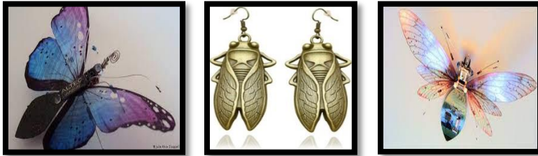
شكل(٤ : ٦) نماذج تشكيلية لهيئات بعض الحشرات المستخدمة في الفن - نقلا عن

وفي مجال التشكيل الفني تعتبر البيئة مصدر من مصادر إلهام الفنان أستلهم كل قوانينها ونظمها البنائية والشكلية - حيث القيم التشكيلية والفنية - وعبر الدراسة للمقررات الدراسية في مجال التربية الفنية بالتربية النوعية، ثم استكمال التجريب في الدراسات العليا لهيئات الحشرات الشكلية التي لم تطبق منها الكثير مما أسترعي أنتباه الدارسة لاستلهم مشغولة نسجية منها وتشكيلها وفق معايير الفن البيئي، واختارت الدارسة عالم الحشرات لأنه عالم ملئ بالتكوينات والسلوكيات الغريبة والعجيبة التي تظهر لنا في الأعشاش وخلايا النحل والشرانق شكل (٤ : ٦)، وقد سخر لنا الله سبحانه وتعالى هذه المخلوقات لتأمل ونفكر في بديع خلقه ونستشعر عظمته في تلك المخلوقات التي تحيا في أمم مثلنا لها نظامها وحياتها وتخطيطاتها.