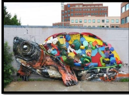
شكل رقم (١١) جدارية من قطع المخلفات الصلبة و نفايات البلاستيك من اعمال الفنان بوردالو- نقلا عن ( https://images.app.goo.gl/nz5TLAsttTRosjit8 )