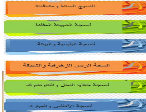
مخطط توضيحي رقم (١) يوضح التراكيب النسجية الزخرفية تصميم الدارسة

ويهدف البحث لانتاج عمل فني بيئي يزين البيئة الطبيعية في الأماكن العامة، حيث تلقى المشغولات النسجية القبول والاستحسان والإعجاب من فئة كبيرة من الجمهور والمستهلكين خاصة المصنعة باستخدام بعض التراكيب النسجية الزخرفية لإضفاء اللمسة الجمالية عليها، كما يلي: